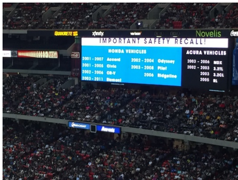
Se exhibió un mensaje de retiro en la pantalla de video del estadio en la Batalla de las Bandas Honda 2016, un evento al que asistieron más de 63,000 personas en Atlanta, Georgia.

Los anuncios de página completa en periódicos en inglés y español están diseñados para atraer la atención de los lectores y recomendarles que reparen sus vehículos.