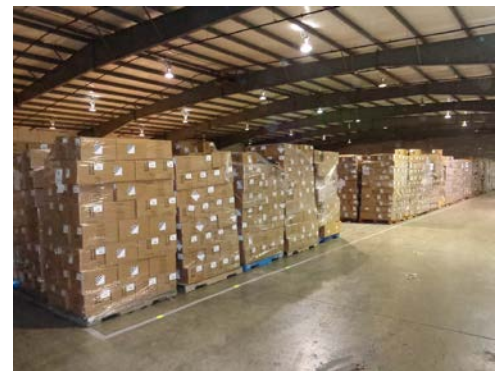
Honda compró más de 80,000 módulos de bolsas de aire que contenían infladores de bolsas de aire retirados de los depósitos de salvamento, para evitar que se vuelvan a colocar en vehículos.