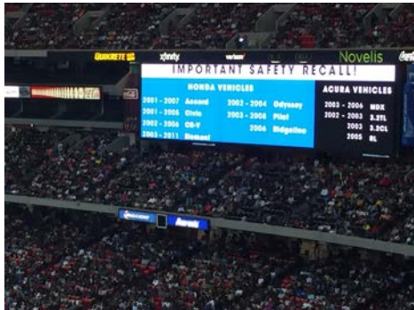
Se exhibió un mensaje de retiro en la pantalla de video del estadio en la Batalla de las Bandas Honda 2016, un evento al que asistieron más de 63,000 personas en Atlanta, Georgia.

Los anuncios de página completa en periódicos en inglés y español están diseñados para atraer la atención de los lectores y recomendarles que reparen sus vehículos.