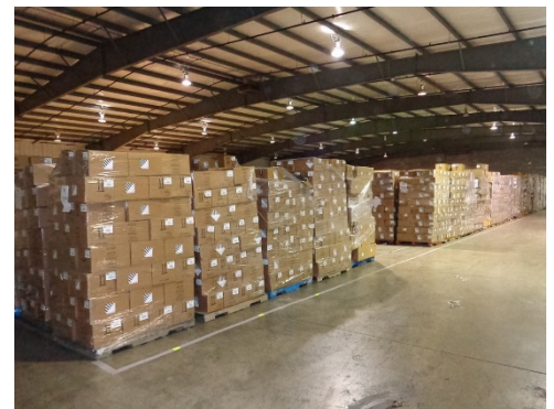
Honda compró más de 130,000 módulos de bolsas de aire que contenían infladores de bolsas de aire retirados de los depósitos de salvamento, para evitar que se vuelvan a colocar en vehículos.